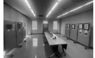
令和5年度の第1弾「夏」の展示の様子