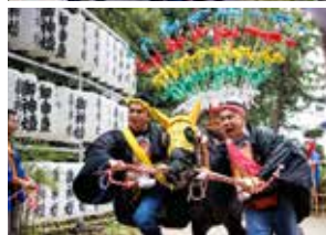
令和5年10月8日(日)の祭礼の様子