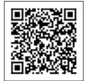
上記の二次元コードをご利用ください。

※「Zoom受講可」の講座でZoom受講希望の場合は希望講座名の後に「Zoom受講」とご記載ください。