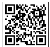
申込みフォーム 二次元コード