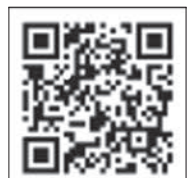
上記の二次元コードをご利用ください

郵送ハガキに必要な事項を記入のうえ、学び支援課(〒470-0192住所不要、申込締切日必着)へご郵送ください。 (注意)消せるボールペンでの記入はご遠慮ください。