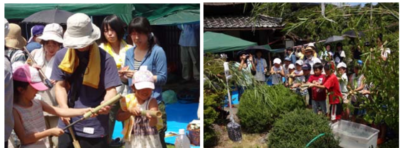
【竹水てっぽう作り】