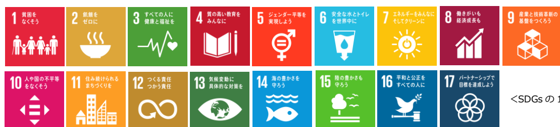
<SDGs の 17 の目標>

「誰一人取り残さない」社会の実現を目指し、2030 年に向け、世界全体がともに取り組むべき普遍的な目標として、2015 年 9 月に国連で採択された「持続可能な開発のための 2030 アジェンダ」に掲げられた持続可能な開発目標(SDGs)を実現するため、施策の充実等に取り組むことが必要になっています。