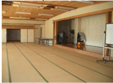
大広間和室(56畳)、ステージ