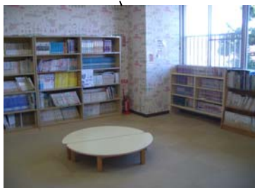
図 書 室