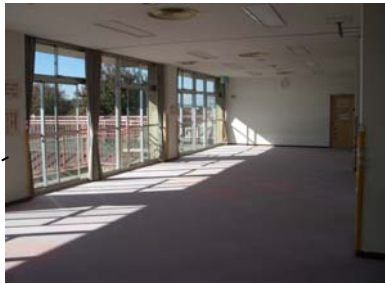
遊 戯 室