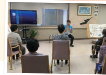
わくわく体操教室