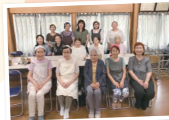
岩崎「庵の会」のみなさん

理学療法士や介護予防リーダー講師による体操教室です。元気なうちから健康づくりに取り組み、健康寿命を延ばしましょう。