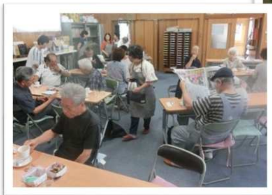
南ヶ丘コーヒーサロン

ぷらっとホームは、子どもから高齢者まで、いつでも誰でも気軽に立ち寄って趣味を楽しんだり、おしゃべりしたりできる地域の交流の場です。