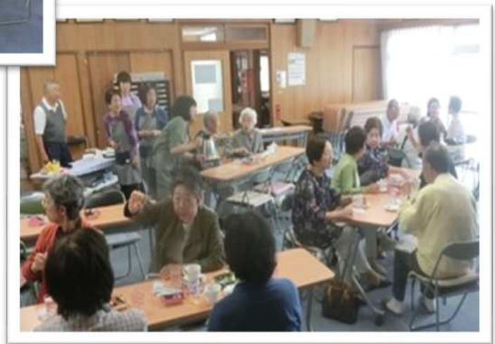
南ヶ丘コーヒーサロン