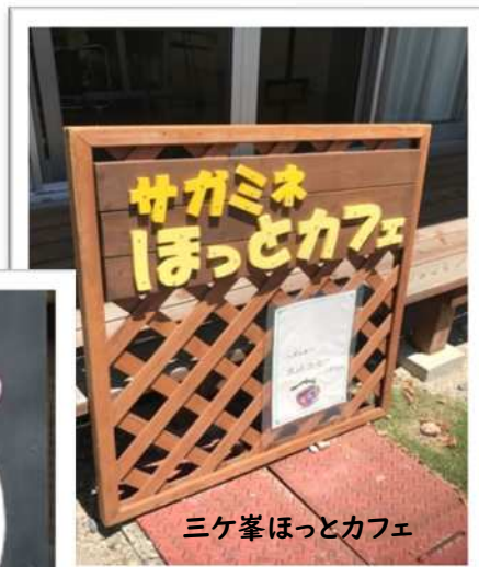
三ヶ峯ほっとカフェ