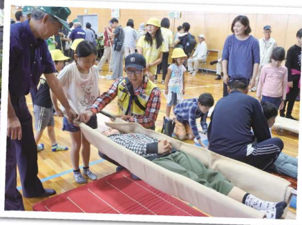
毛布と物干竿を使った応急担架訓練