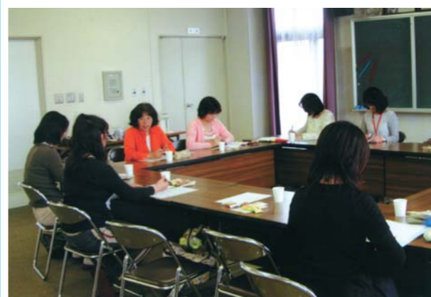
主任児童委員部会

現在、民生委員・児童委員協議会には「生活福祉部会」「高齢者福祉部会」「心身障がい者福祉部会」「母子・児童福祉部会」「防災防犯部会」「主任児童委員部会」「広報部会」の7部会があります。 今年度は「心身障がい者福祉部会」「主任児童委員部会」の二つの部会の紹介をいたします