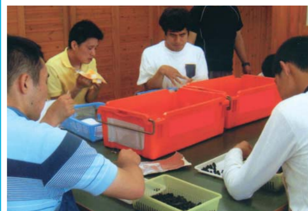
心身障がい者福祉部会