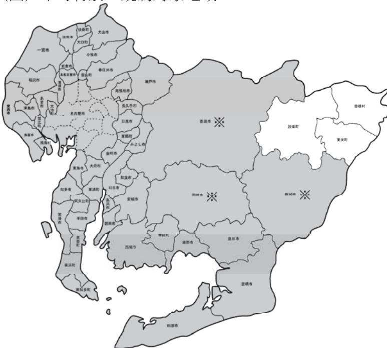
(図) 市町村別の規制対象地域

北設楽郡の設楽町、東栄町及び豊根村を除く県内市町村の、都市計画法の「工業専用地域」及び「都市計画区域以外の地域」を除く地域 (※) が規制対象となります。