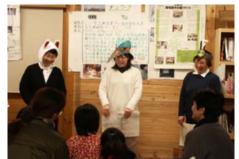
かんきょう談話会