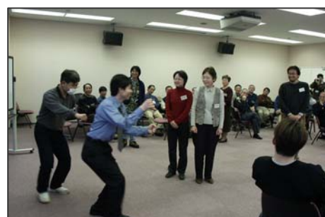
市民と市職員の初顔合わせでのゲーム