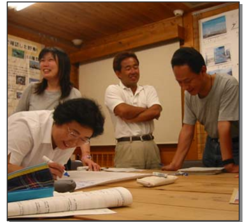
ライフスタイル分科会