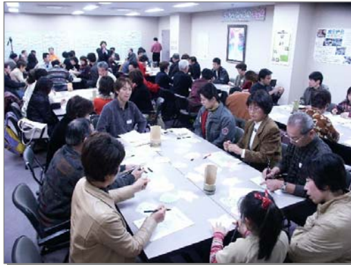
市民に呼びかけ環境を話し合った「かんきょう談話会」の様子

事業所における環境改善委員会の設置促進、事業所における環境学習の推進、事業者の環境まちづくりに取り組む人材育成事業者間ネットワークの構築、事業者も参加するエコマネー制度の導入、ISO取得の支援、低金利で貸し付けるエコバンク 46 の創設、事業者参加の市民会議の設置