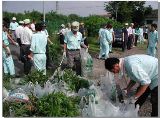
事業者による地域清掃活動の様子