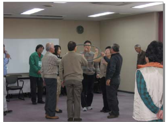
みんなで作る環境まちづくり講座の様子