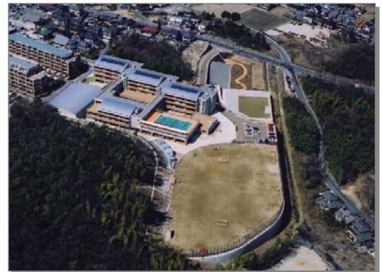
市民開放施設を併設した梨の木小学校

既存の地縁コミュニティを活性化させるとともに、誰もが参加しやすく楽しいコミュニティとして7つの小学校区の持ち味を活かしたコミュニティづくりを進めることで、地域における開かれたつながりをつくり、みんなが主役で楽しく輝くまちをめざしていきます。