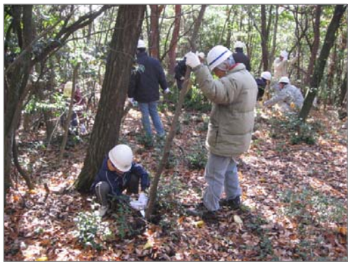
地域参加による学習林づくり(梨の木小学校)

利用しやすいコミュニティ施設の整備と地域での自主管理の推進、 地域の伝統・行事の伝承、地域で伝統・技術を持った人の発掘と活用、学び教える場(寺子屋等)の創出、地域リーダー養成学校(講座)、関心・テーマごとのコミュニティとのネットワークづくり