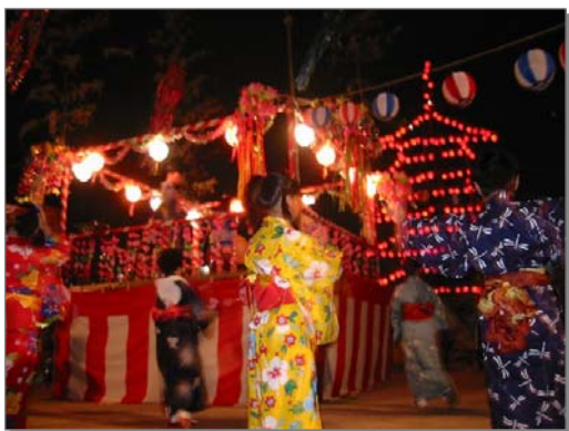
地域の盆踊り大会(赤池)