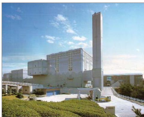
環境対策が施された東郷美化センター

ISO取得の支援、事業所における環境改善委員会の設置促進、事業所における環境学習の推進