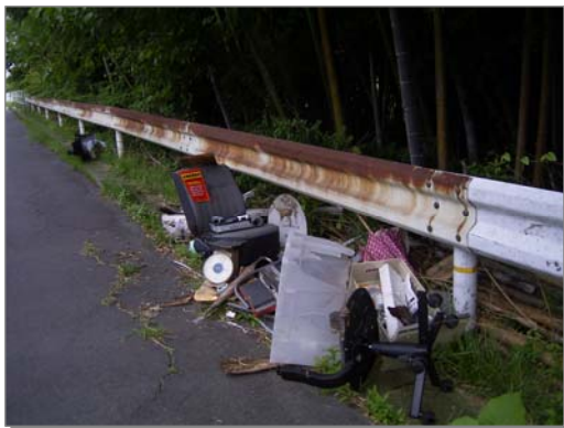
不法投棄現場調査

フロンの確実な回収、ノンフロン化の推進 地球温暖化防止の観点からの緑地の位置づけと保全、地球環境問題に対する適切な対応策の検討