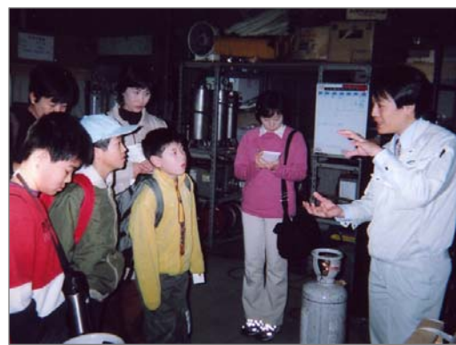
こどもプロジェクトによるフロン回収工場の見学