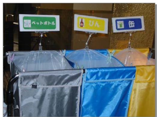
市役所での環境配慮活動の様子