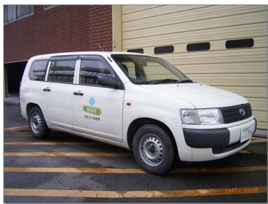
市所有の天然ガス車

公害防止のための体制強化、事業者と地域との対話の推進、市民による環境監視モニター制度の導入 地球温暖化への警鐘、エコカーの必要性のPR、市民向けエコカー購入補助、公用車のエコカー転換、天然ガス車の導入、エコエネルギーステーションの誘致、事業所におけるエコカー導入促進、ノーカーデーの試験的实施