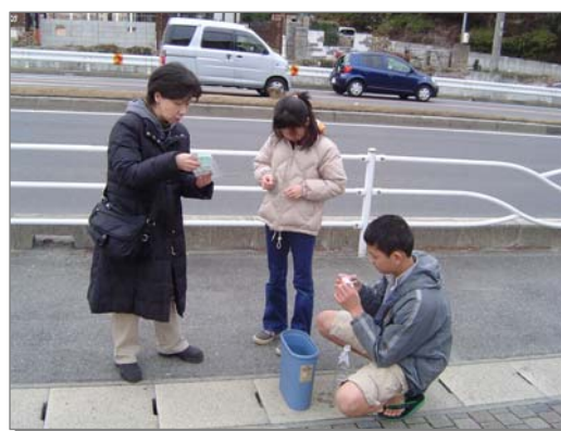
子どもプロジェクトによる道路大気環境調査の様子