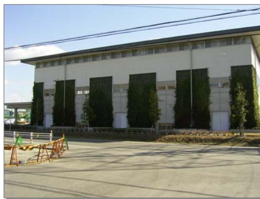
上納池スポーツ公園体育館における壁面緑化

サーチライトへの規制づくり、ライトアップ・街路灯などのガイドライン作成、親子の星空観察会の実施