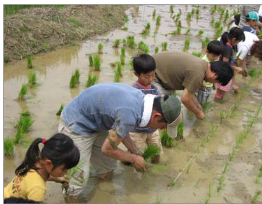
農業体験講座の様子

農業レストランの開設、特産市の開催、養鶏・牛耕ができる場の設置、貸し農園の奨励、果樹園オーナー制、子どもの体験農業の場づくり（みかんの木を植えて収穫して管理）、農作業体験の場の提供、ふれあい交流施設の整備 農業講座の開設、農業公園におけるコミュニティの場・市民同士の意見交換の場の提供、漬物名人など発掘・紹介、市民参加・ボランティアによる農業公園計画づくりと実践