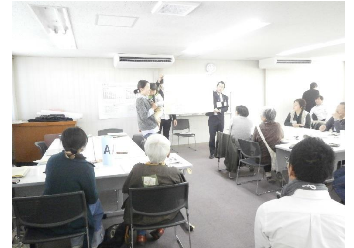
(平成30年11月23日（金・祝）に開催された第1回市民策定ワーキンググループの様子)