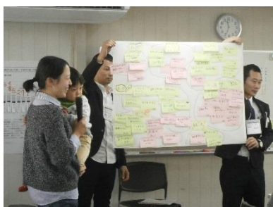
ワーキングの様子