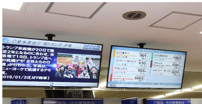
<モニター画面のイメージ図>