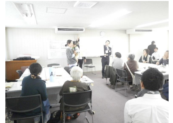
(平成30年11月23日(金・祝)に開催された第1回市民策定ワーキンググループの様子)