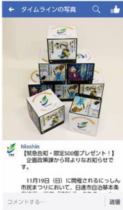
フェイスブック紹介記事

市公式フェイスブックの紹介記事に「いいね！」をしていただくか、日進市自治基本条例の街頭アンケートにお答えいただいた方を対象とし、全部で約400個を配布しました。