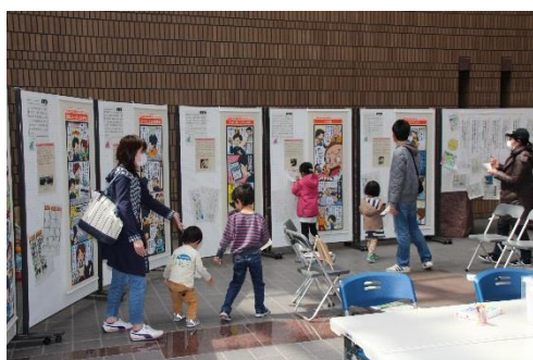
パネル展示を見る来場者

最終日の3月18日（日）には、市民団体「場リスタNext」との協働で、特別ミニイベントとして、4コママンガキャラクターのオリジナル缶バッジが作れるコーナー、展示に関するクイズ、まちづくりに関する絵本や紙芝居の紹介、アンケートを行いました。