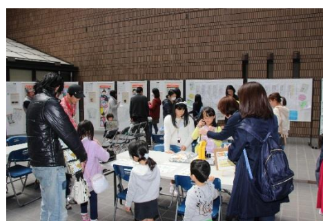
缶バッジ製作の様子