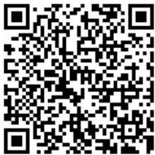
スマホ向け QR コード