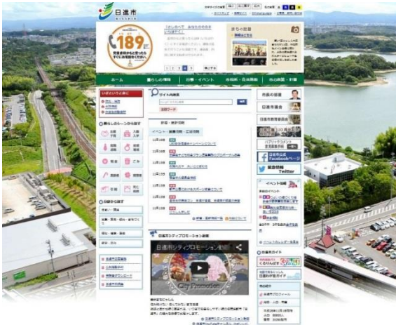
市ホームページトップ画面