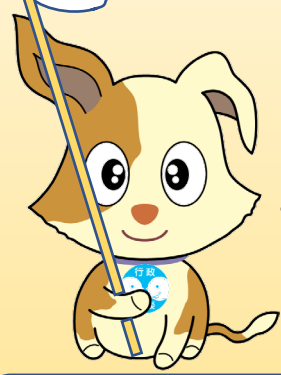
総務省 行政相談キャラクター キクーン

〈開設時間〉 10時～12時、13時～15時 相談時間の目安は30分です。 相談受付は、当日会場までお越しください。