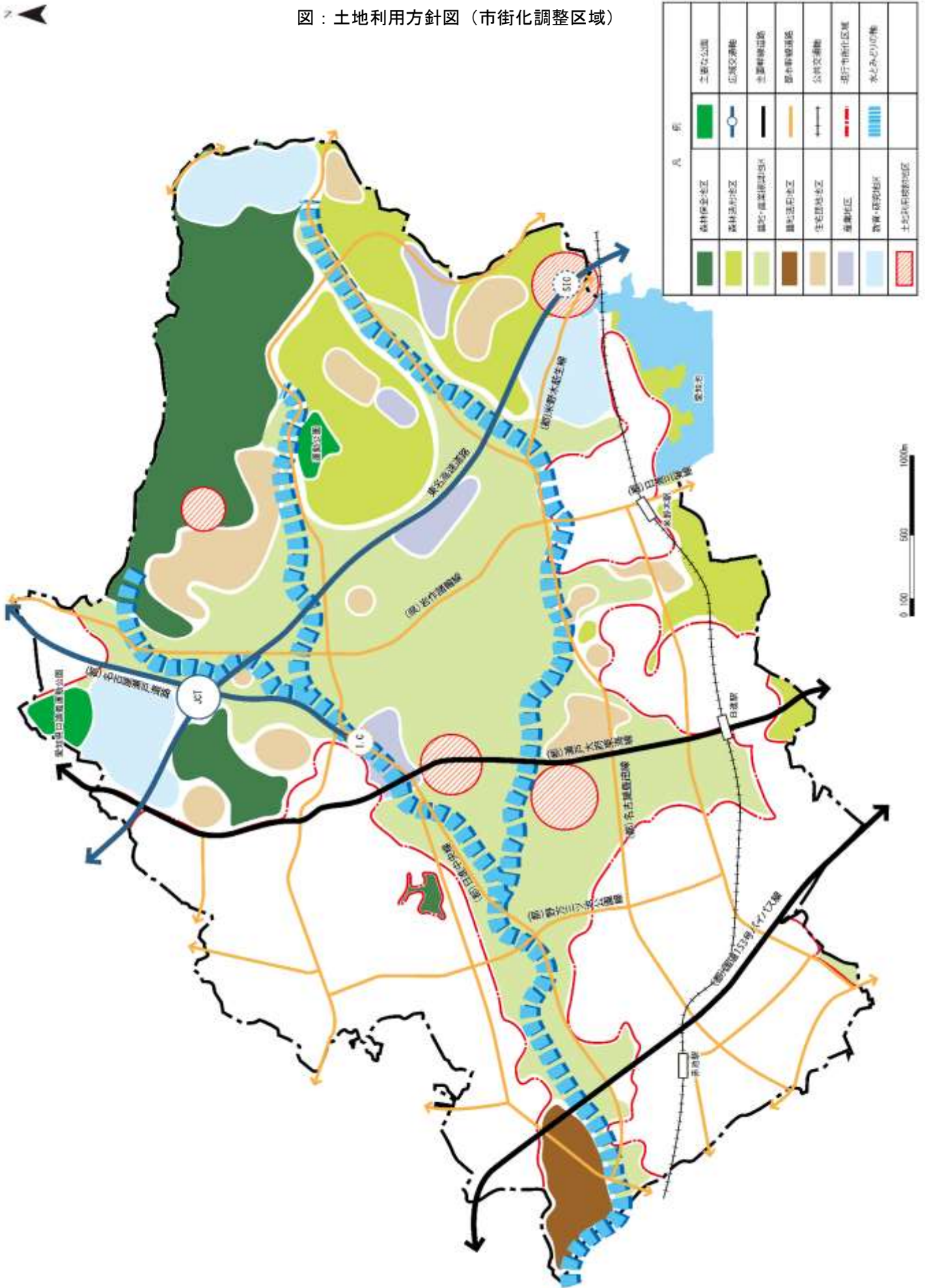
図：土地利用方針図（市街化調整区域）