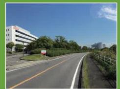
日進研究開発団地