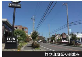
竹の山地区の街並み