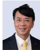
日進市長 近藤 裕貴