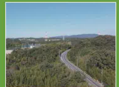
日進東部開発検討地区周辺を撮影