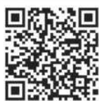
（ハローワーク ホームページ）

・履歴書不要 ・入退場自由 ・雇用保険受給者は求職活動実績になります。 ・行政ブース出展予定 ・（雇用保険の相談、市会計年度任用職員登録案内・仕事説明・障害者任用、保育園入園案内、シルバー人材センター案内など） 詳細や参加企業はハローワークホームページをご確認ください。