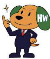
愛知ハローワーク キャラクター はろわん君