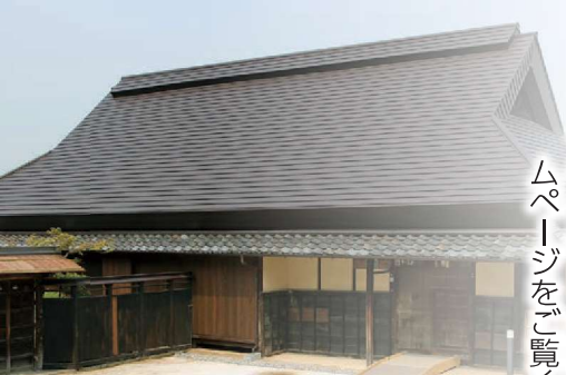
↑令和2年度の展示風景