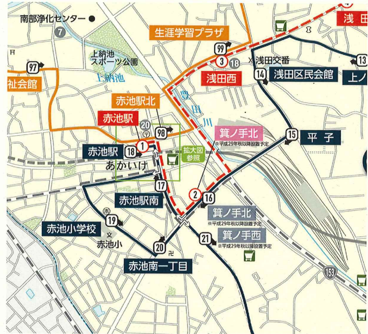
〈箕ノ手北、箕ノ手西バス停周辺拡大図〉

※上記の内容で設置することにつきまして同意いただける場合は、合意書をご提出ください。