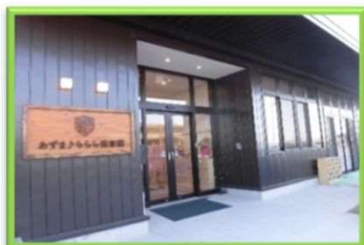
【ホームページQRコード】