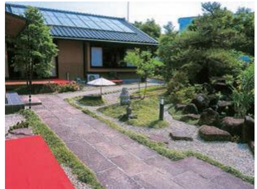
オープンガーデン