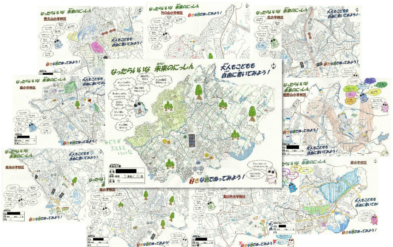
図 2018年（平成30年）にしん市民まつり「未来のにしん おえかきブース」作品より

豊かな緑を尊重し、都市の活力と多様な交流でにぎわう 持続可能な都市環境を私たちが育む