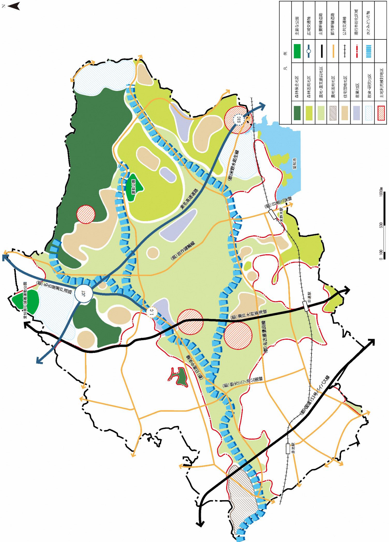
図 5-2 土地利用方針図（市街化調整区域）