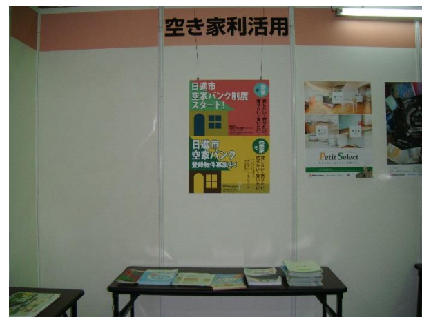
「あいち住まいるフェア2017」におけるポスター掲示及びリーフレット配布状況