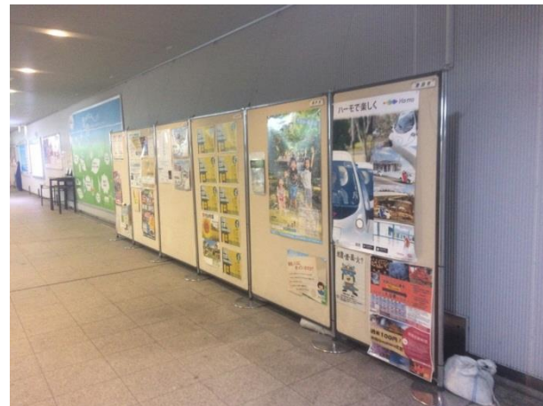
リコモ 藤が丘駅におけるポスター掲示状況