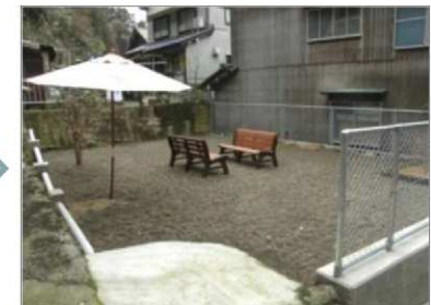
【福井県越前町】 老朽化した空き家住宅を除却し、ポケットパークとして活用