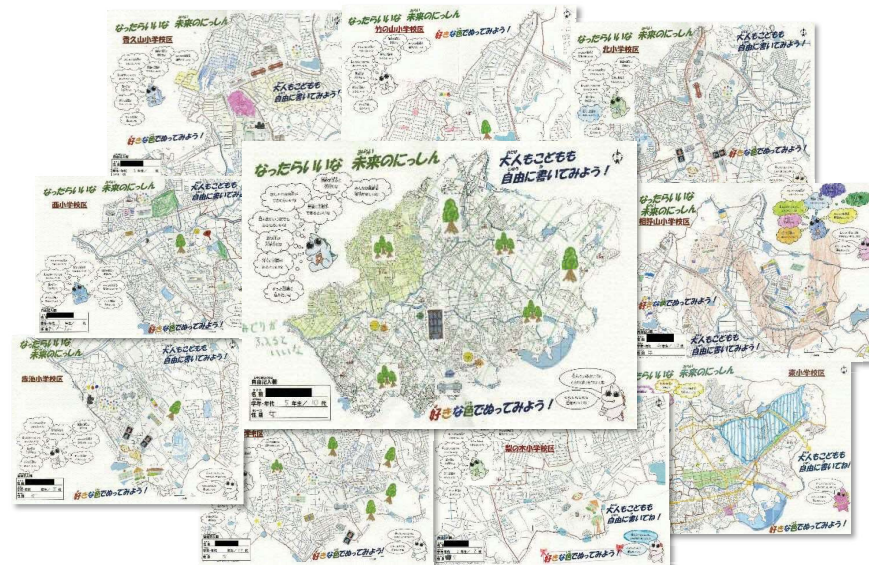
図3-1 2018年（平成30年）にしん市民まつり「未来のにしん おえかきブース」作品より

豊かな緑を尊重し、都市の活力と多様な交流でにぎわう 持続可能な都市環境を私たちが育む