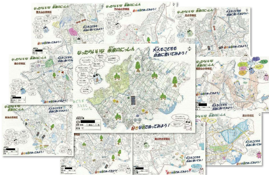
図3-1 2018年（平成30年）にしん市民まつり「未来のにしん おえかきブース」作品より

豊かな緑を尊重し、都市の活力と多様な交流でにぎわう 持続可能な都市環境を私たちが育む