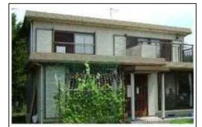
空家利活用事例 ぶらっとホーム「サンハウス東山」 (日東東山)