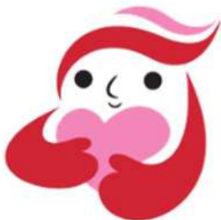
犯罪被害者等支援シンボルマーク 「ギョッとちゃん」