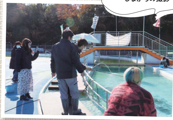
総合運動公園では 釣りを実践 しながらの撮影