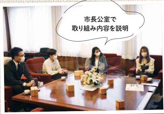
市長公室で 取り組み内容を説明

名古屋外国語大学学生会の皆さんには、市内のスポット紹介リール（動画）制作に当たり、場所選びや、実際に体験しながらの撮影、動画編集をしていただきました。大学生の視点だけでなく、市外在住のメンバーの視点も生かして、「初めて知った面白そうなスポット」も撮影してもらいました。