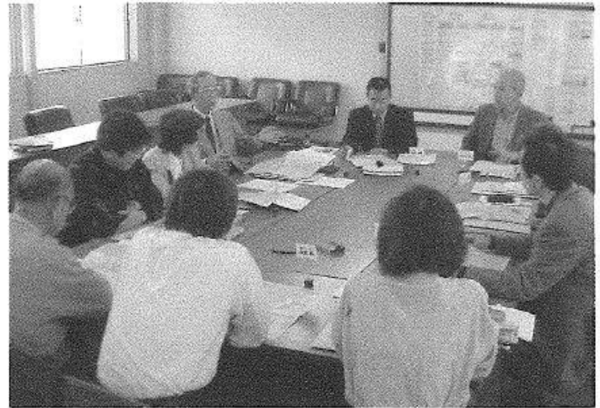
策定委員会の様子