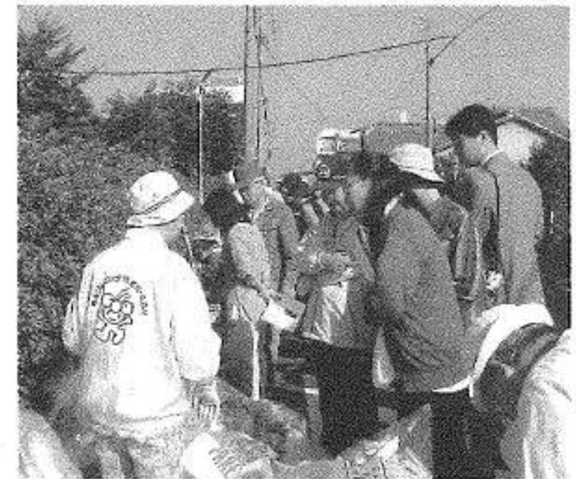
先進事例視察(名古屋市の資源収集ステーション)の様子