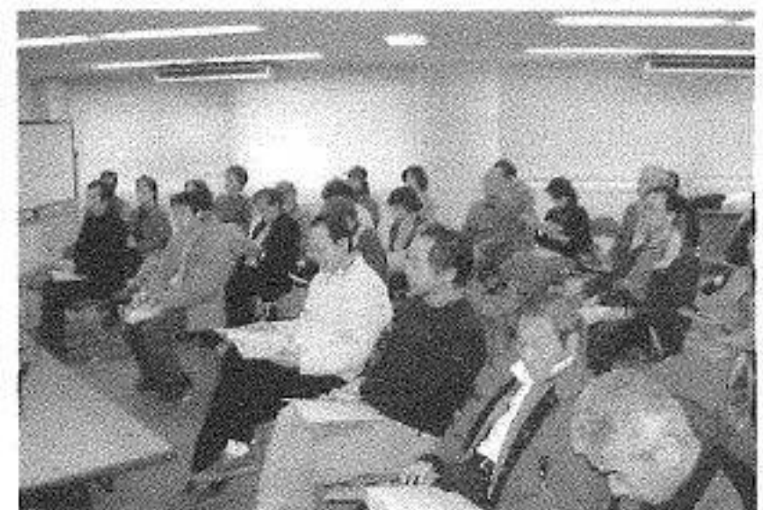
市民フォーラムの様子